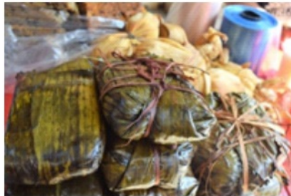
Figura 2. Tamales

Las hojas de plátano suelen utilizarse en la elaboración de diversos platillos, así como para envolver y conservar en buen estado diversos alimentos. Recuperado de: https://www.animalgourmet.com/2016/12/01/cocina-tradicional-campeche-tesoro-escondido-sureste-mexicano/