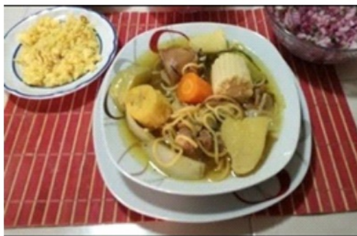
Figura 1.- Puchero de tres carnes